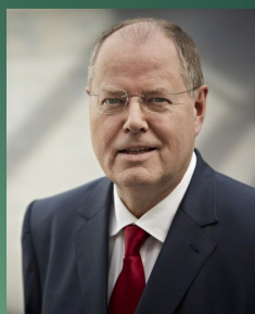
Peer Steinbrück Deutscher Finanzminister a. D.